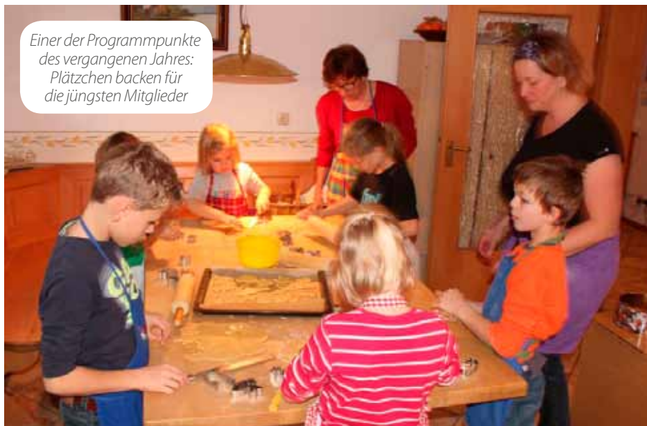
Einer der Programmpunkte des vergangenen Jahres: Plätzchen backen für die jüngsten Mitglieder